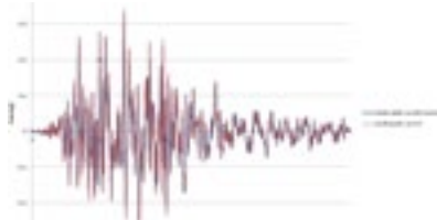
Yüksek Benzeşim- Bir deprem testi sırasında uygulanan ve ölçülen ivme verilerinin karşılaştırması

YÜKSEK KAPASİTELİ SARSMA MASASI, gerçek ölçeğe yakın modelleri test etmek için tasarlanmıştır. Kayıtlı depremleri simule edebilir, sinüs, üçgen vb. tanımlı dalgaları ve kullanıcının tanımlayacağı herhangi bir ivme ya da pozisyon profilini uygulayabilir.