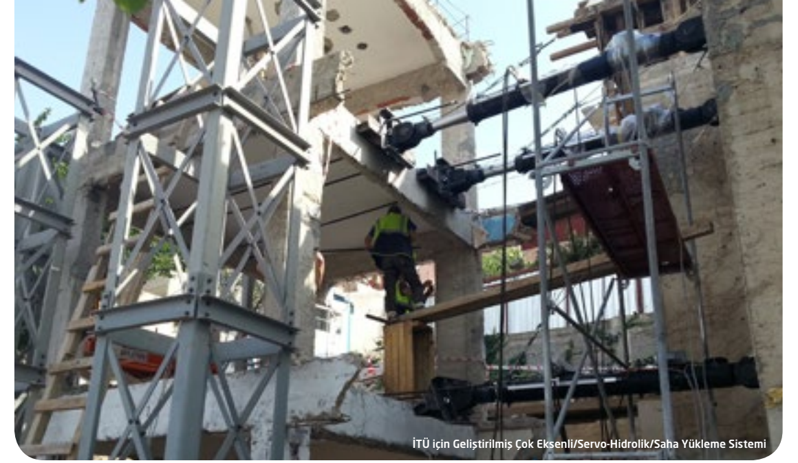
İTÜ için geliştirilmiş Çok Eksenli/Servo-Hidrolik/Saha Yükleme Sistemi